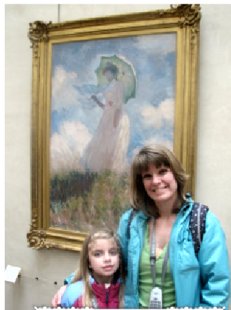
Claude Monet Paris 1840 - Giverny 1926

Essai de figure en plein air ou Femme à l'ombrelle tournée vers la gauche 1886